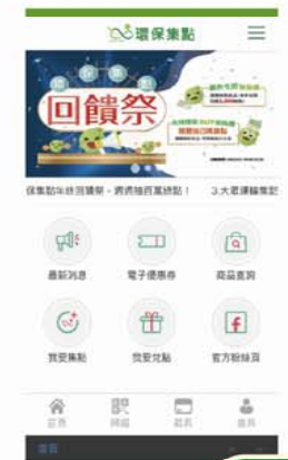
5 登入APP, 開始參加活動