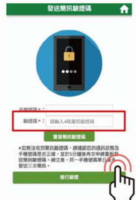
4 收取4碼簡訊驗證碼, 輸入後點選進行驗證