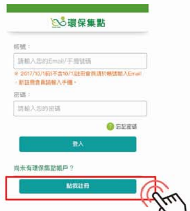
2 點擊申請集點帳號