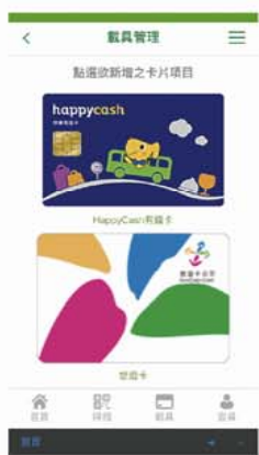
3 選擇欲綁定卡片類別