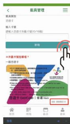
4 依提示輸入外觀卡號後送出